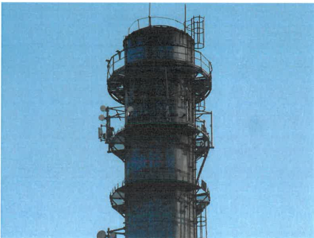
Widok instalacji radiokomunikacyjnej Stacja Netia ZYRDW001 - ZYRDM00001 Żyrardów, ul. Rotmistrza Witolda Pileckiego 82.