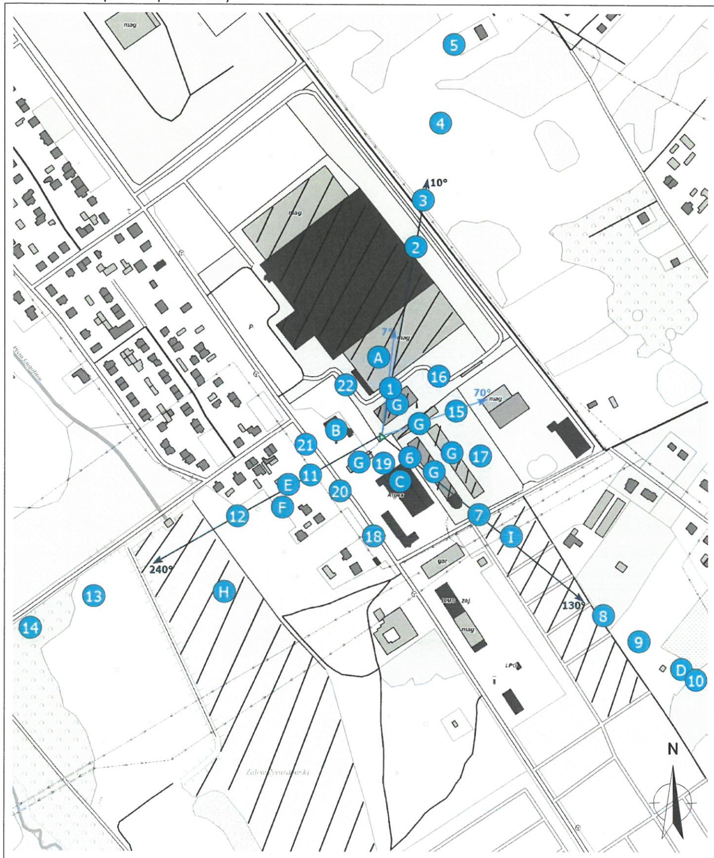
Zał. 2. Widok pionów pomiarowych